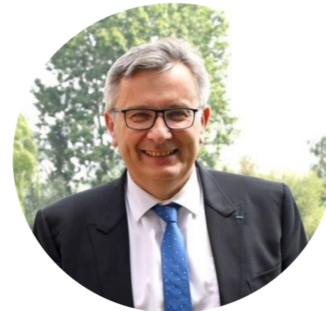
Maire de Gravelines Président du Syndicat de l'Eau du Dunkerquois