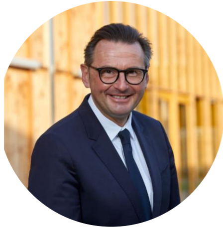
Maire d'Arras Président de la Communauté Urbaine d'Arras