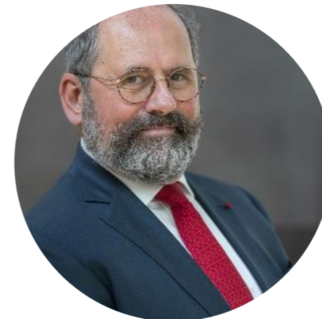
Maire de Sceaux Vice-Président de la Métropole du Grand Paris