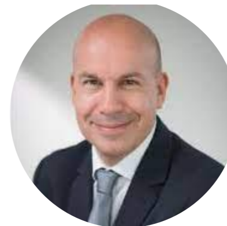
Maire de Saint-Aubin Président délégué de la Communauté d'Agglomération Paris-Saclay