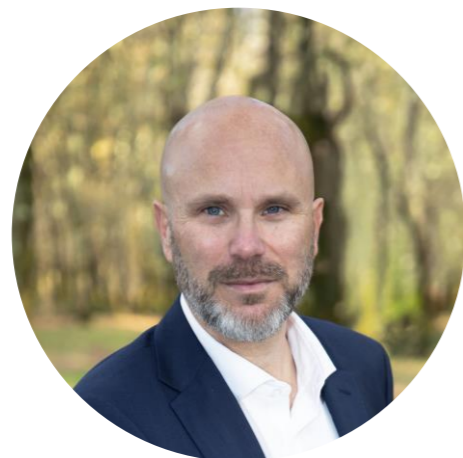
Maire de Sainte-Hélène Président de la Communauté de Communes Médullienne