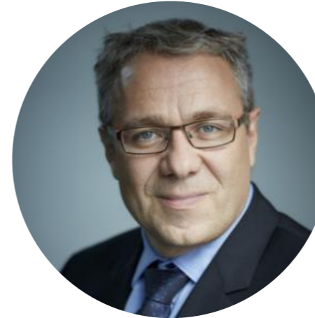
Vice-Président de la Région Bourgogne-Franche-Comté