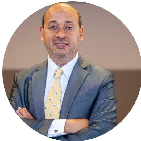
Maire de Badevel Vice-Président Pays de Montbéliard Agglomération