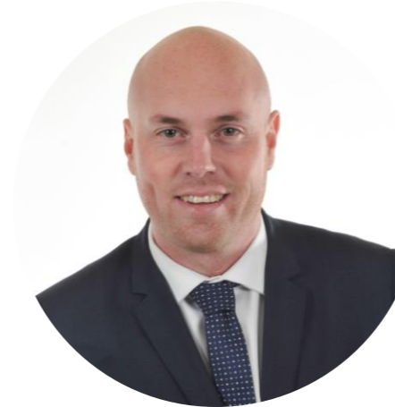
Maire de Cappelle-la-Grande Vice-Président de la Communauté Urbaine de Dunkerque