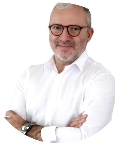
Président de Nevers Agglomération et Maire de Nevers