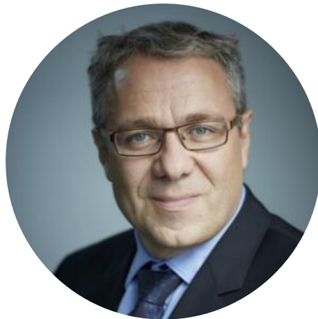
Vice-Président Région Bourgogne-Franche-Comté