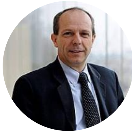
Secrétaire Général Fondateur