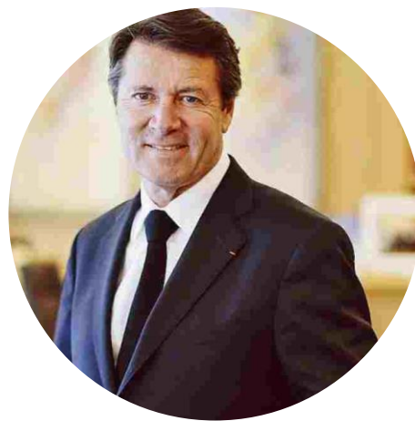
Président de la Métropole Nice Côte d'Azur et Maire