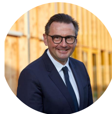
Président Communauté Urbaine d'Arras