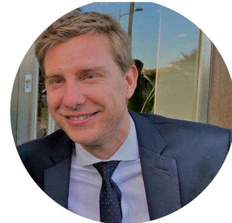
Directeur Général des Services Adjoint