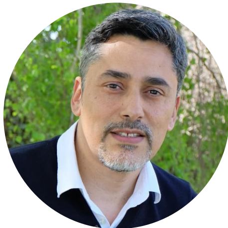
Agence d'Attractivité CAP SUD 66 – Perpignan Méditerranée