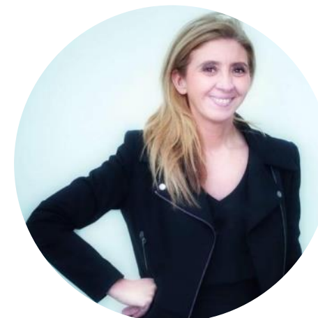
Conseillère territoriale - CA Plaine Commune Grand Paris