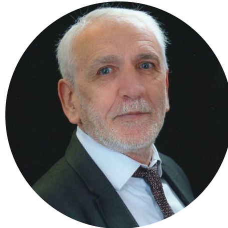
Directeur Général des Services