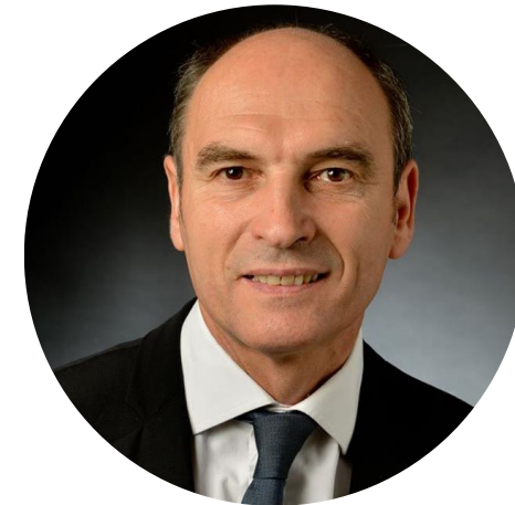
Vice-Président Nevers Agglomération