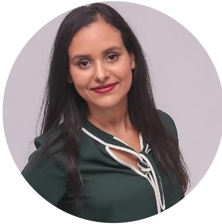
Adjointe au Maire Rueil-Malmaison