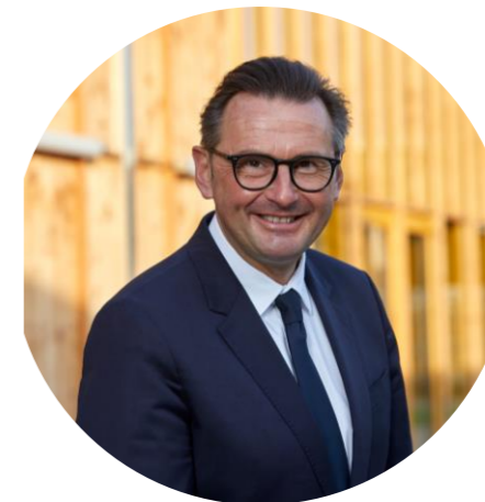
Président Communauté Urbaine d'Arras