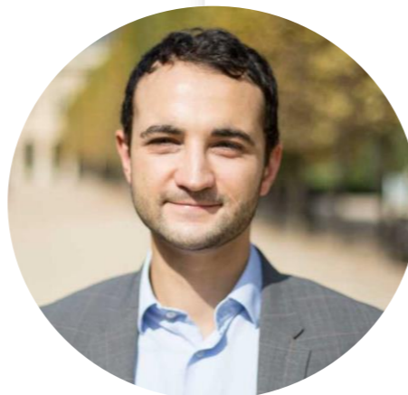
Conseiller en droit du numérique et à la cybersécurité