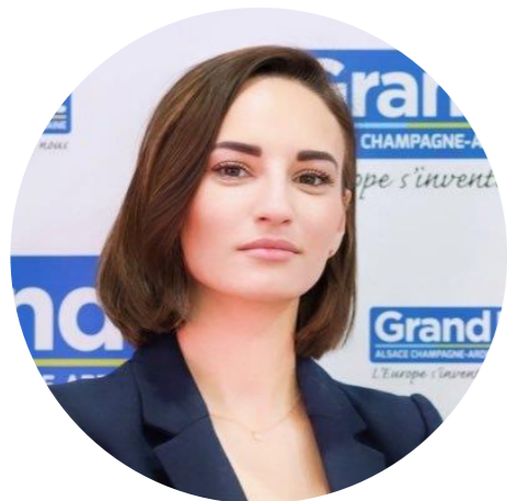
Vice-Présidente Région Grand Est