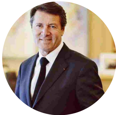
Maire de Nice Président de la Métropole Nice Côte d'Azur