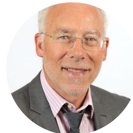
Maire de Thèzeval