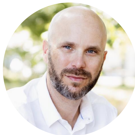
Conseiller Ruralité et Innovation