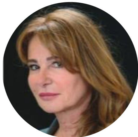
Conseillère à la Santé connectée