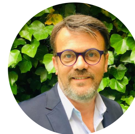
Conseiller au Territoire intelligent