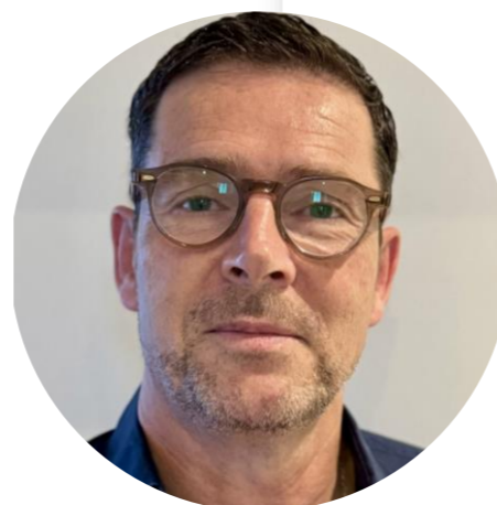
Conseiller Habitable durable