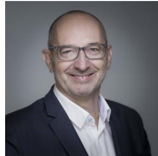
Conseiller à la Communication