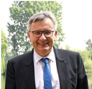
Maire de Gravelines Vice-Président de la Communauté Urbaine de Dunkerque