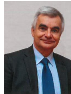
Conseiller aux entreprises et aux collectivités