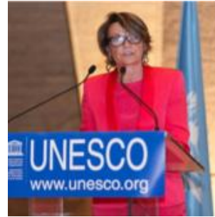
Conseillère à l'Innovation écologique