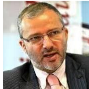
Président de Nevers Agglomération, Maire de Nevers