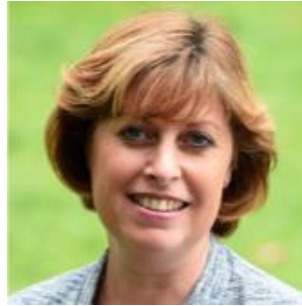
Vice-Présidente de la C-U. de Dunkerque, Maire déléguée de Coudekerque-Village