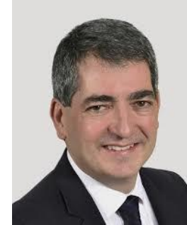
Président Conseil Régional Grand Est