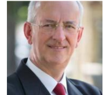
Président de la C.C. Cœur de France, Maire de Saint-Amand- Montrond