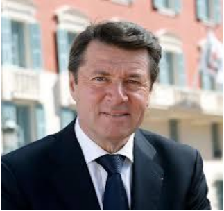
Maire de Nice Président de la Métropole Nice Côte d'Azur