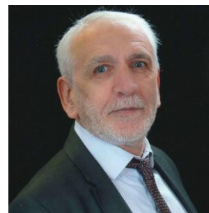
Directeur Général des Services