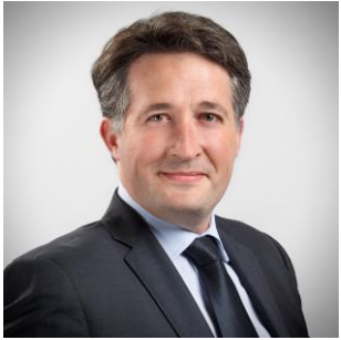
Conseiller à l'Éducation numérique