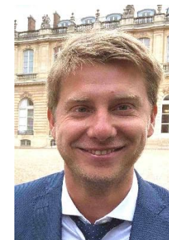
Directeur du Développement