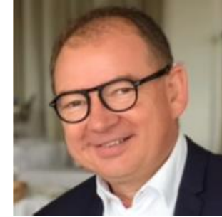
Conseiller à la Formation