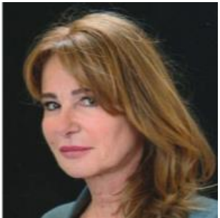
Conseillère à la Santé connectée