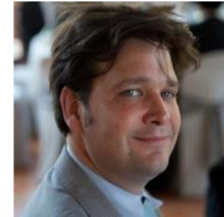
Conseiller au Numérique